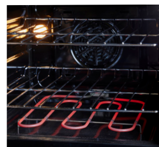
Four à convection