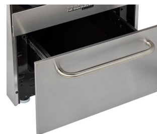
Tiroir de rangement