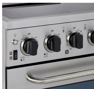
Boutons modernes conçus pour une utilisation facile