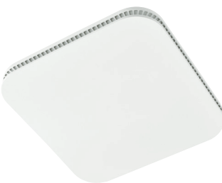
AE80K | AE110K