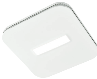
AE80LK | AE110LK