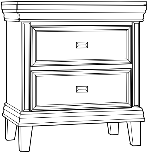
Nightstand/Table de nuit 1x